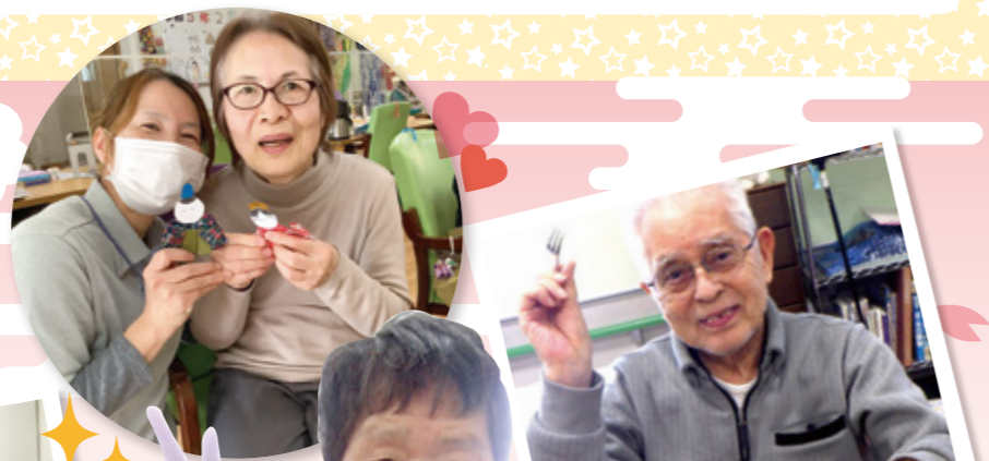
おいしくいただきました！

かわいい雛人形を眺めながら、笑顔で迎える春の訪れ♪ お雛様作りやケーキバイキングでひな祭りを楽しみました。