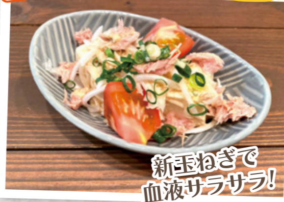
新玉ねぎで血液サラサラ!

3月頃から出回る新玉ねぎですが、普通の玉ねぎと比べ、みずみずしく辛みが少なく、甘みがあってやわらかいのが特徴です。新玉ねぎと玉ねぎの違いは品種の違いと乾燥して出荷しているかないかの違いになり栄養素に大きな違いはありません。栄養素を逃がさないためには、生で食べたり加熱しすぎないことがポイントです。また、ビタミンB 1 を含む食材と一緒にとると疲労回復効果が期待できます。